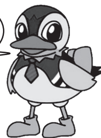
佐野日大公式マスコットキャラクター さにつぴー