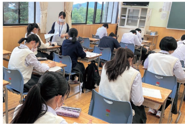
第1期6月14日(火)~7月19日(火) (全学年対象 特別進学コース2年、3年は除く)

コースの枠を超えて受講できる新たな課外授業がスタートした。個々の生徒の基礎学力、及び応用力の養成のため、生徒たちは自分の伸ばしたい教科とレベルを自身で選択し、受講することができる。9月も基礎学力到達度テストに向けて各教科で実施した。なお、夏休み期間中は校内セミナーや特訓ゼミも行った。