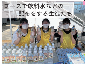
ブースで飲料水などの配布をする生徒たち

7月18日(月)、第12回さのクールアースデー2022(会場:佐野駅前周辺)にてボランティア活動を行った。環境問題をテーマとしたイベントで、インターアクトクラブのメンバーは、受付や景品の配布などを行った。