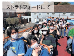
ストラトフォードにて