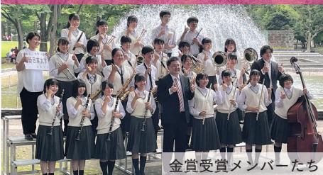
金賞受賞メンバーたち

8月6日(土)、第64回栃木県吹奏楽コンクール高等学校の部B部門が宇都宮市文化会館で行われ、本校の吹奏楽部が金賞を受賞した。2015年以来、7年ぶりの金賞獲得である。このコンクールで3年生は引退となり、有終の美を飾ることができた。