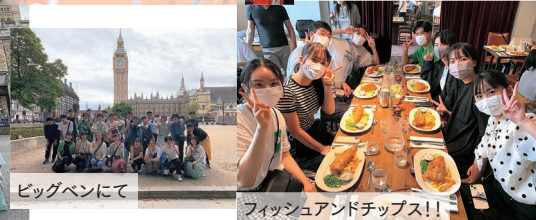
フィッシュアンドチップス!!