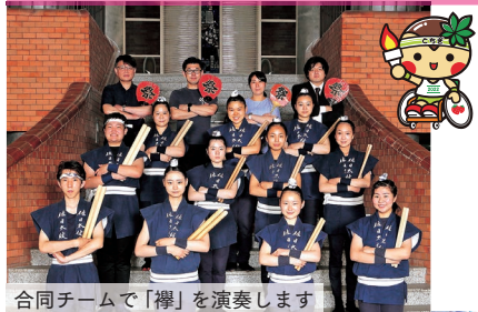
合同チームで「櫻」を演奏します