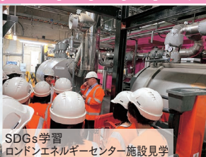
SDGs学習 ロンドンエネルギーセンター施設見学