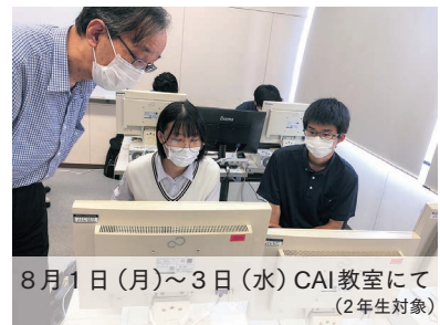
8月1日(月)~3日(水) CAI教室にて (2年生対象)