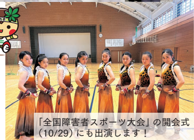
「全国障害者スポーツ大会」の開会式(10/29)にも出演します!