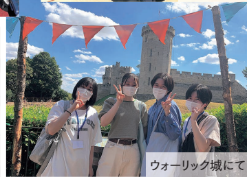
ウォーリック城にて