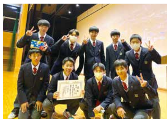
優勝した「Help」のみなさん